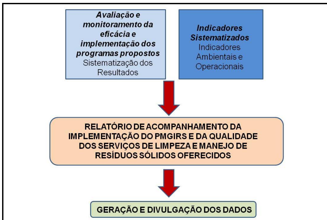
Figura 2 - Fluxograma de implementação do PMGIRS